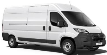
Biela Icy - pastelová