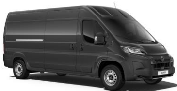
Sivá Graphito (čierna) - metalická