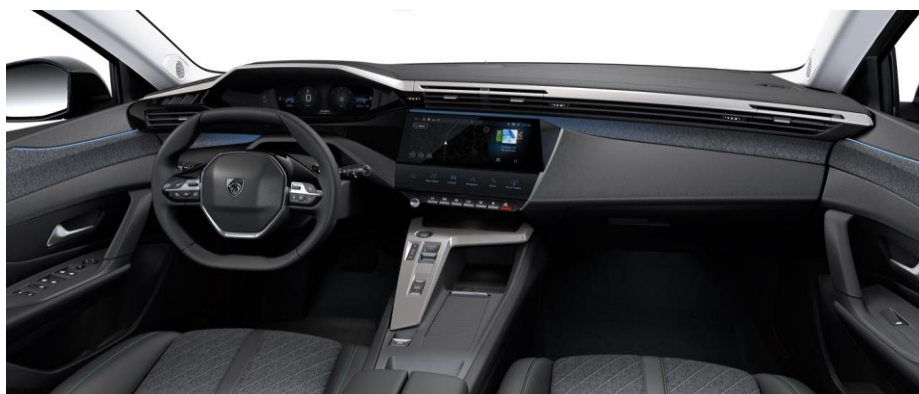
ALLURE - palubná doska s dekorom TEXA