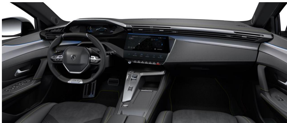
GT - palubná doska s chrómovým dekorom a zeleným prešivaním