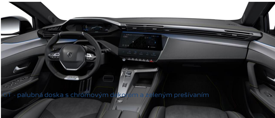
GT - palubná doska s chrómovým dekorom a zeleným prešívaním