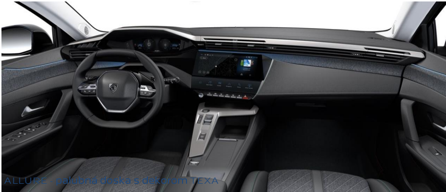
ALLURE - palubná doska s dekorom TEXA