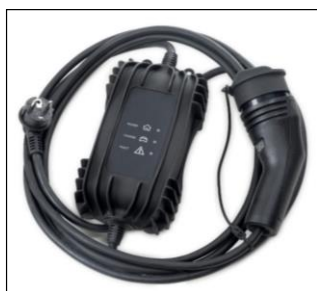
Štandardný kábel pre zapojenie do domácej 230V zásuvky 98 505 251 80