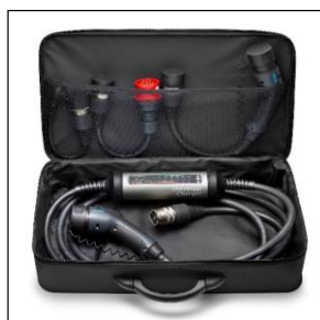
Súprava s nabíjacou jednotkou pre zapojenie do viacerých druhov elektrickej siete (230V/400V/WallBox) 98 460 314 80