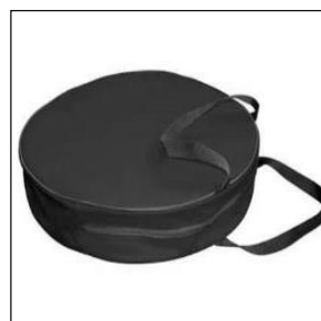
Taška na nabíjacie káble Peugeot 98 493 006 80