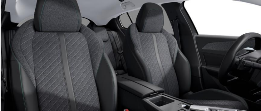
ALLURE- poťah FRACTIL (U3FX)