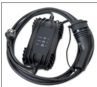
Štandardný kábel pre zapojenie do domácej 230V zásuvky 98 505 251 80