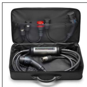
Súprava s nabíjacou jednotkou pre zapojenie do viacerých druhov elektrickej siete (230V/400V/WallBox) 98 460 314 80