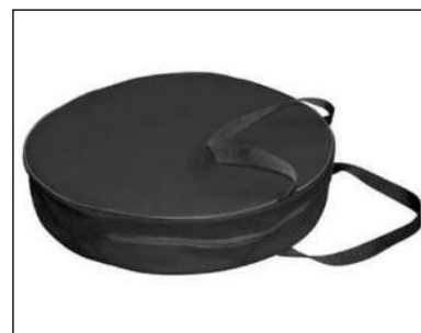
Taška na nabíjacie káble 98 412 134 80