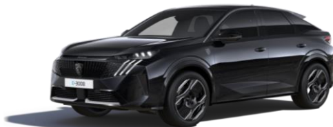
Čierna PERLA NERA