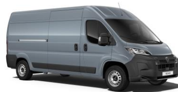
Sivá Iron - ZWMO metalická