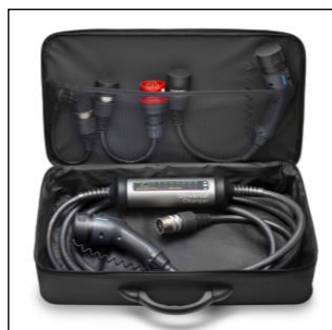
Súprava s nabíjacou jednotkou pre zapojenie do viacerých druhov elektrickej siete (230V/400V/WallBox)