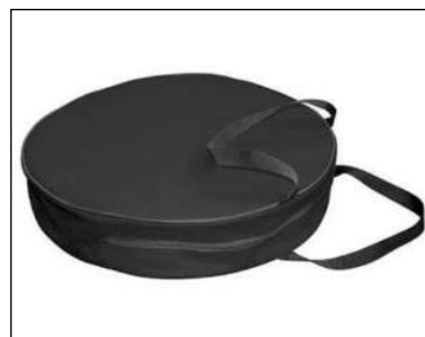
Taška na nabíjacie káble