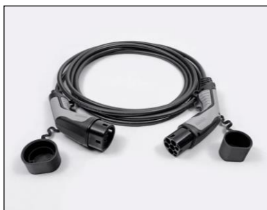
Kábel režimu 3 pre pripojenie do nabíjacej stanice (domácejho WallBoxu alebo verejnej stanice)