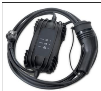
Štandardný kábel pre zapojenie do domácej 230V zásuvky