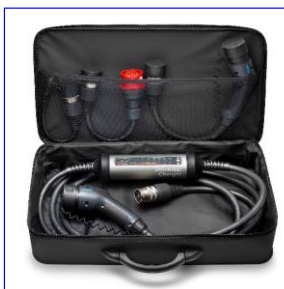
Súprava s nabíjacou jednotkou pre zapojenie do viacerých druhov elektrickej siete (230V/400V/WallBox) 98 460 313 80