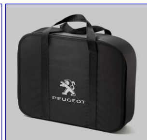
Taška na nabíjacie káble Peugeot 98 493 006 80