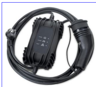
Štandardný kábel pre zapojenie do domácej 230V zásuvky 98 467 444 80