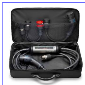
Súprava s nabíjacou jednotkou pre zapojenie do viacerých druhov elektrickej siete (230V/400V/WallBox) 98 460 313 80