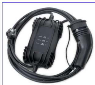
Štandardný kábel pre zapojenie do domácej 230V zásuvky 98 467 444 80